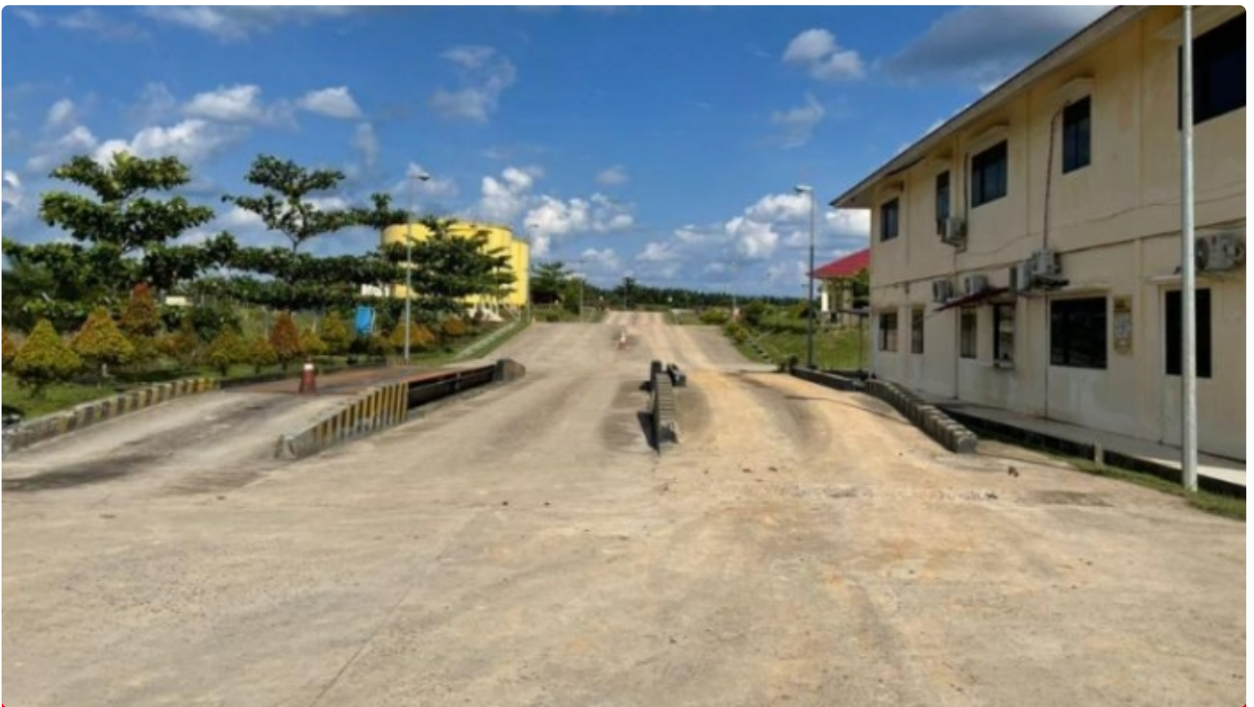
Pabrik PT Berkala Maju Bersama (PT BMB) Kecamatan Manuhing Kabupaten Gunung Mas

PALANGKA RAYA - Kisruhnya keadaan perusahaan yang bergerak di bidang perkebunan kelapa sawit di Kecamatan Manuhing Kabupaten Gunung Mas (Gumas), Kalimantan Tengah (Kalteng) yaitu PBS PT Berkala Maju Bersama (PT BMB).